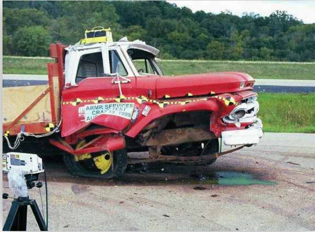
Vehículo de 7 toneladas lanzado con 48 km/h, después un choque contra 3 pilonas (bajo la autoridad del departamento del Estado Americano)